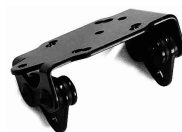
2 Gedämpftes Oberteil Shock absorbing Bracket