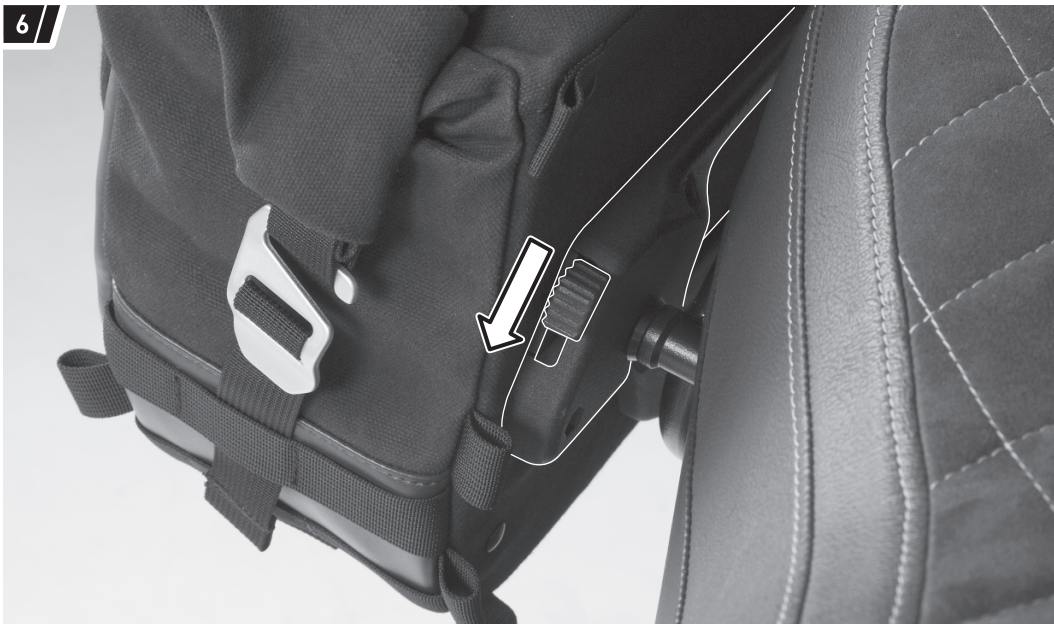
Befestigung und Fahrzeug dienen als Beispiel. / Fixation and vehicle are examples.

Drücken Sie zum Entriegeln der Seitentasche (1a/1b) einfach den gezeigten Schieber des Verschlussmechanismus nach unten.