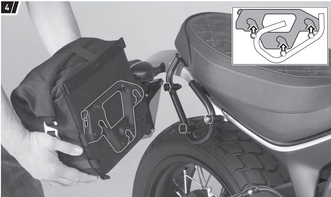
Befestigung und Fahrzeug dienen als Beispiel. / Fixation and vehicle are examples.

Setzen Sie die drei Öffnungen des Schnellverschluss-Systems auf die Aufnahmebolzen des montierten SLC Seitenträgers.