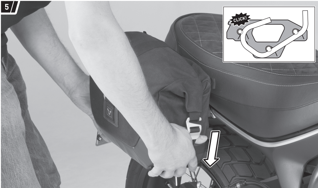
Befestigung und Fahrzeug dienen als Beispiel. / Fixation and vehicle are examples.

Drücken Sie anschließend die Seitentasche (1a/1b) leicht nach unten, bis diese fest am SLC Seitenträger sitzt.