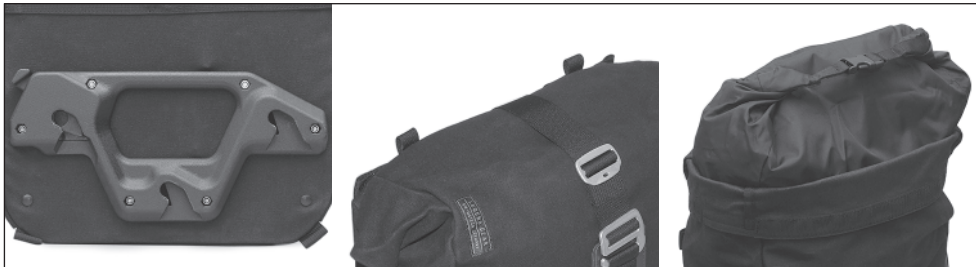
Features (von links nach rechts): Schnellverschluss-System; Laschen für den Schultergurt (separat erhältlich); Wasserdichte Innentasche. Features (from left to right): Quick release fastening system; Loops for the shoulder strap (sold separately); Waterproof Innerbag.