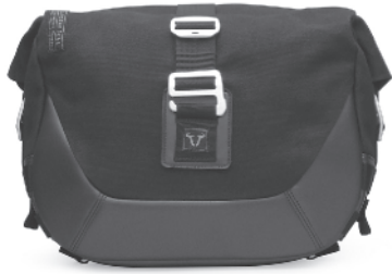
1a 1x Seitentasche LC1 Side Bag LC1 BC.HTA.00.401.10+00 L / R