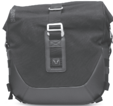
1b 1x Seitentasche LC2 Side Bag LC2 BC.HTA.00.402.10+00 L / R