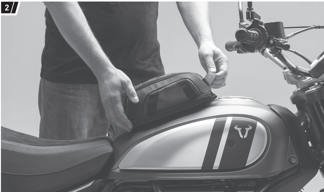
Befestigung und Fahrzeug dienen als Beispiel. / Fixation and vehicle are examples.

ATTENTION: Make sure that the area of the vehicle, which has contact with the product, is protected with the adhesive protection film (4) from scratches and abrasions.