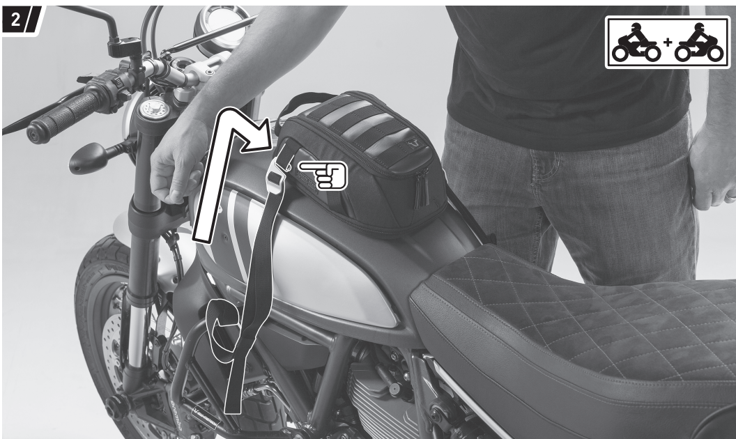
Befestigung und Fahrzeug dienen als Beispiel. / Fixation and vehicle are examples.

On both sides entangle two straps (2) to appropriate and reliable attachment points of the vehicle (e.g. vehicles frame, crashbar etc.).