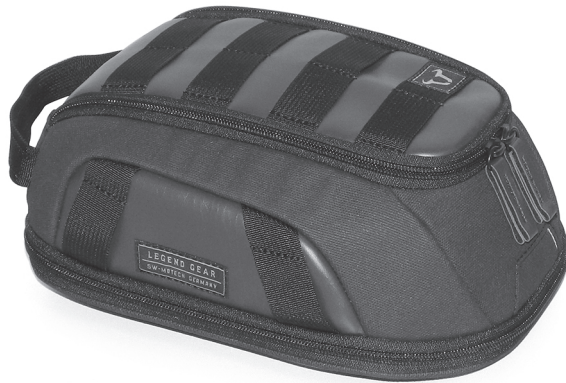
1 1x Tankrucksack LT1 Tank Bag LT1