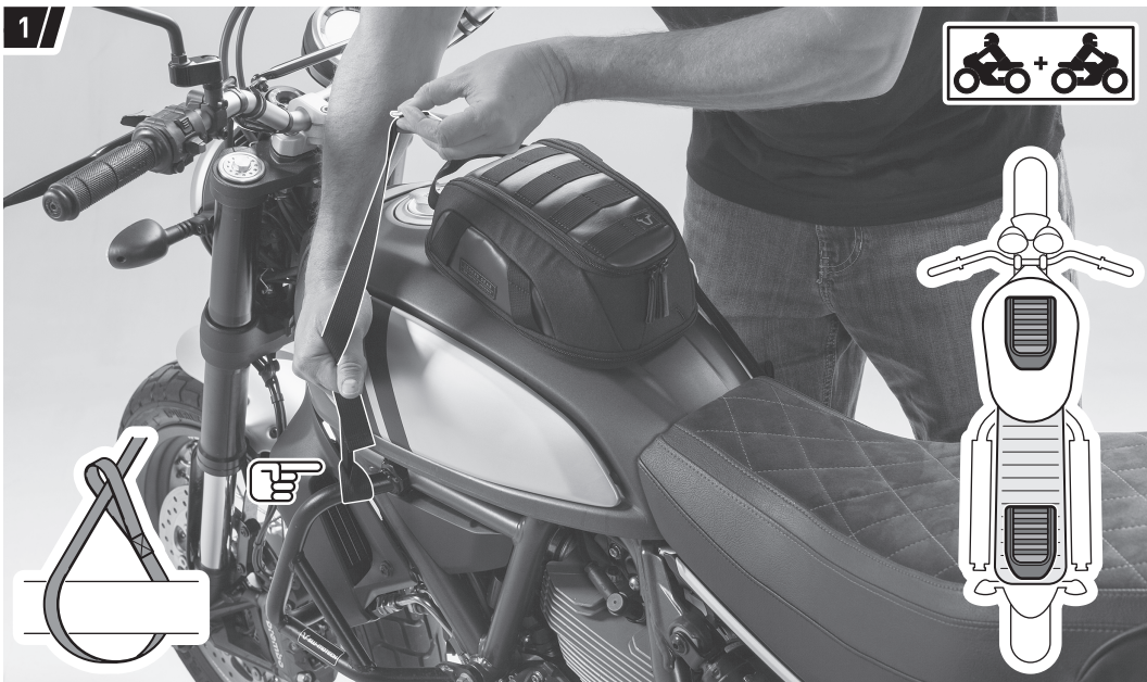
Befestigung und Fahrzeug dienen als Beispiel. / Fixation and vehicle are examples.