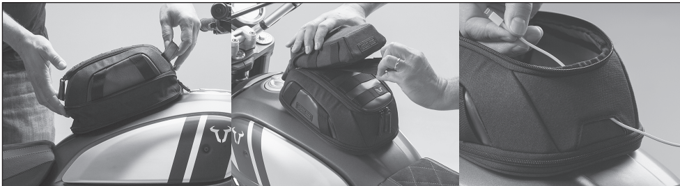
Features (von links nach rechts): Volumenerweiterung (3 l zu 5,5 l); Universelles Befestigungssystem; Kabeldurchlass. Features (from left to right): Volume expansion (3 l to 5.5 l); Universal fixation system; Cable feed-through.